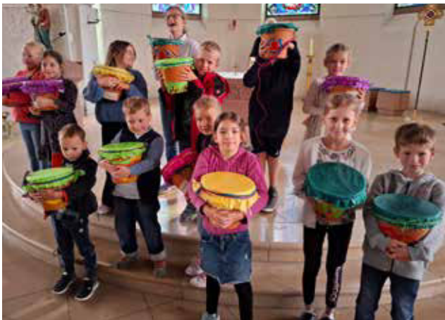
Lobt ihn mit Trommel und Reigentanz, lobt ihn mit Saiten und Flöte! (Ps 149,3)

(siehe Bild). Aus Ton-Blumentöpfen, Seidenpapier, Kleister und Farbe entstanden tolle Trommeln, die zu einem bunten individuellen Kunstwerk gestaltet wurden. Zum Einsatz kamen sie auch bei einem Lied der Gemeinde, das die Kinder beim ökumenischen Gottesdienst mit begleiteten.