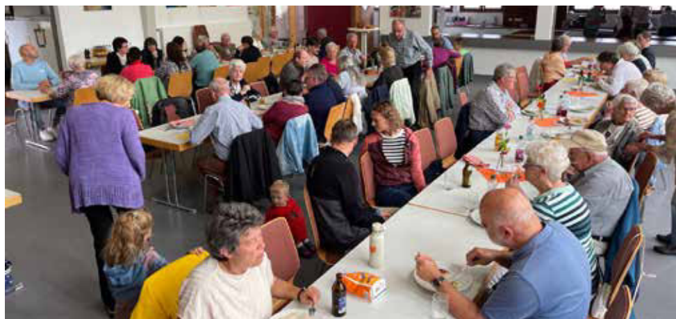
Unterhaltung in lockerer Atmosphäre

des Himmels“. Alles wurde noch durch die passenden Lieder des Projektchors „Kreuz und Quer“ unterstrichen, der von Marco Friedrich geleitet wurde. Alle anwesenden Gemeindeglieder erlebten einen wunderschönen, harmonischen, in sich stimmigen Gottesdienst, der durch Gemeindelieder und Gebete abgerundet wurde.