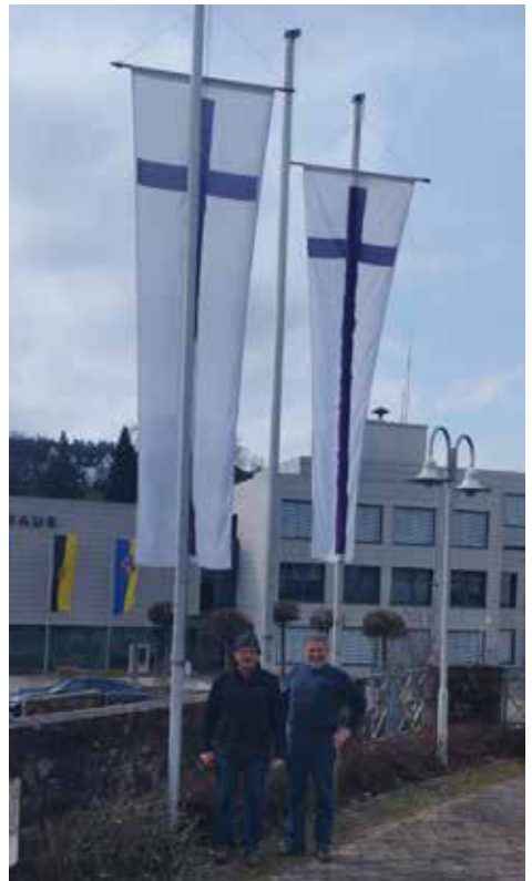
zwei (von drei) „Heinzelmännchen“ beim Reparieren der Fahnenmasten

All' das muss getan und organisiert werden. Dafür sei mal an dieser Stelle allen stillen Helfern, allen Ehrenamtlichen im Hintergrund ganz herzlich „Danke!“ gesagt. Danke, dass es euch gibt!