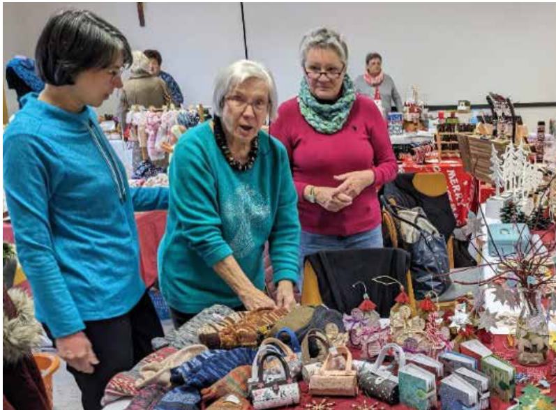
Bastelkreis beim Lichtermarkt

Küche im Gemeindesaal, von Tischen und Stühlen bis hin zur Mitfinanzierung von Anschaffungen in der Gemeinde. Ebenfalls bastelten und gestalteten sie