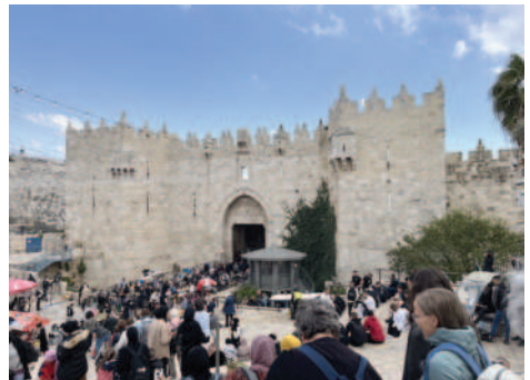
Damaskustor in Jerusalem

Die biblischen Texte in der Gottesdienstordnung, besonders Psalm 85 und Eph 4,1–7 können in der aktuellen Situation tragen. Mit ihnen kann für Gerechtigkeit, Frieden und die weltweite Einhaltung der Menschenrechte gebetet werden. Die Geschichten der drei Frauen in der Gottesdienstordnung geben einen Einblick in Leben, Leiden und Hoffnungen in den besetzten Gebieten. Sie sind Hoffungskeime, die deutlich machen, wie Menschen aus ihrem Glauben heraus Kraft gewinnen, sich für Frieden zu engagieren. Ihre Erzählungen sind eingebettet in Lieder und Texte, die den Wunsch nach Frieden und Gerechtigkeit und vor allem die Hoffnung darauf ausdrücken.