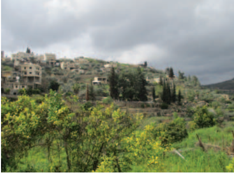
Battir nahe Jerusalem

Die Gottesdienstordnungen für den ersten Freitag im März haben lange Entstehungsgeschichten. In Deutschland ist diese mit der Veröffentlichung der Liturgie im September des Vorjahres abgeschlossen. Die Texte, Lieder und Gebete spiegeln den Alltag, die Leiden und die Hoffnungen der Christen wider, die sie entwickelt haben, um sie mit anderen weltweit zu teilen.