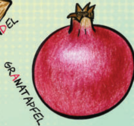
GR A N A T A P F E L