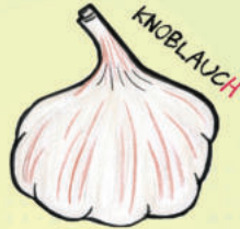
KN O BLA U CH