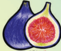
FEI G E