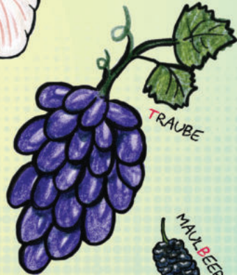
TR A U B E