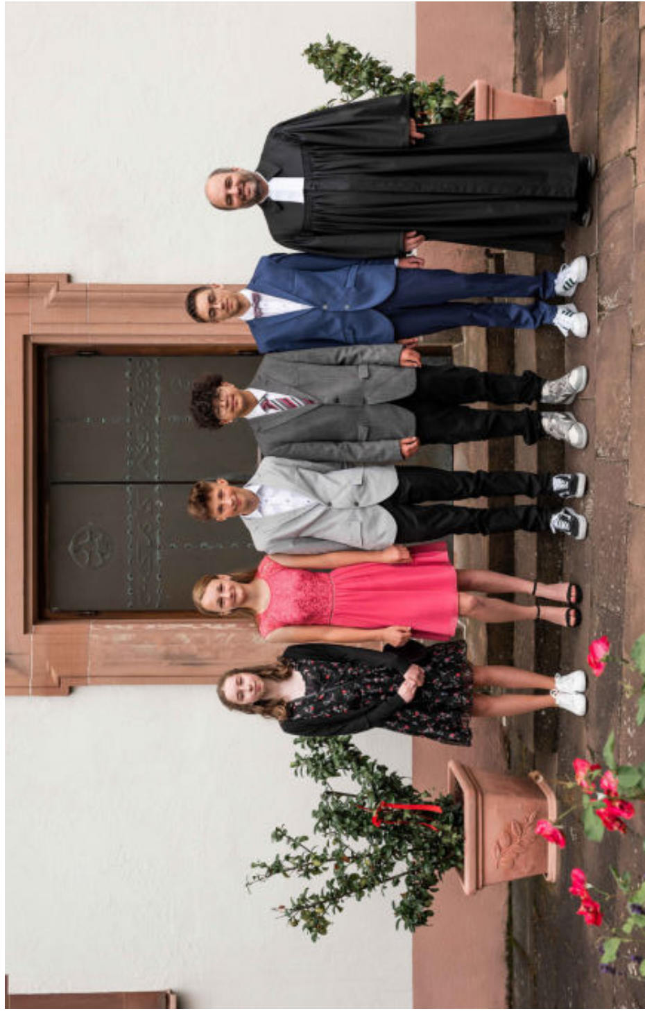
Konfirmation am 11. Juli 2021 in Obrbrigheim