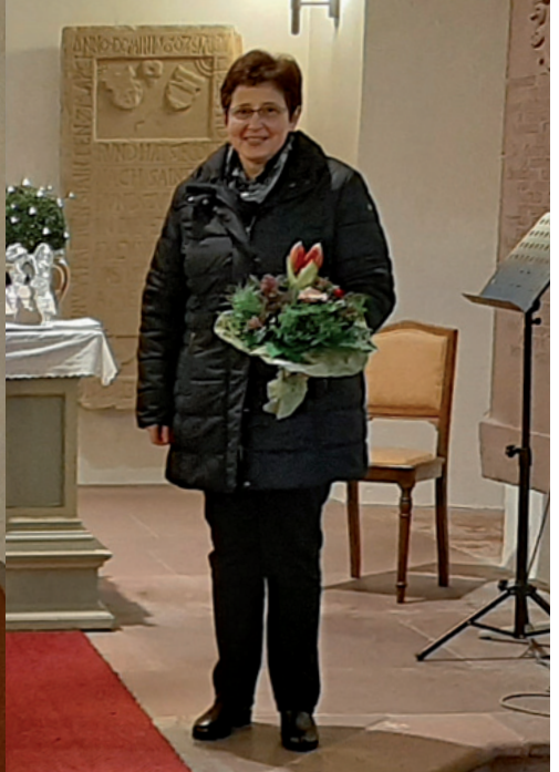
Mitarbeitergottesdienst am 13. Dezember 2020 in Obrigheim