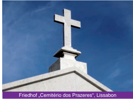
Friedhof „Cemitério dos Prazeres“, Lissabon

Indem wir im kommenden Jahr bei allen Umbrüchen eine Neuausrichtung auf den wagen, dessen Ankunft