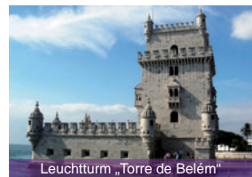
Leuchtturm „Torre de Belém“