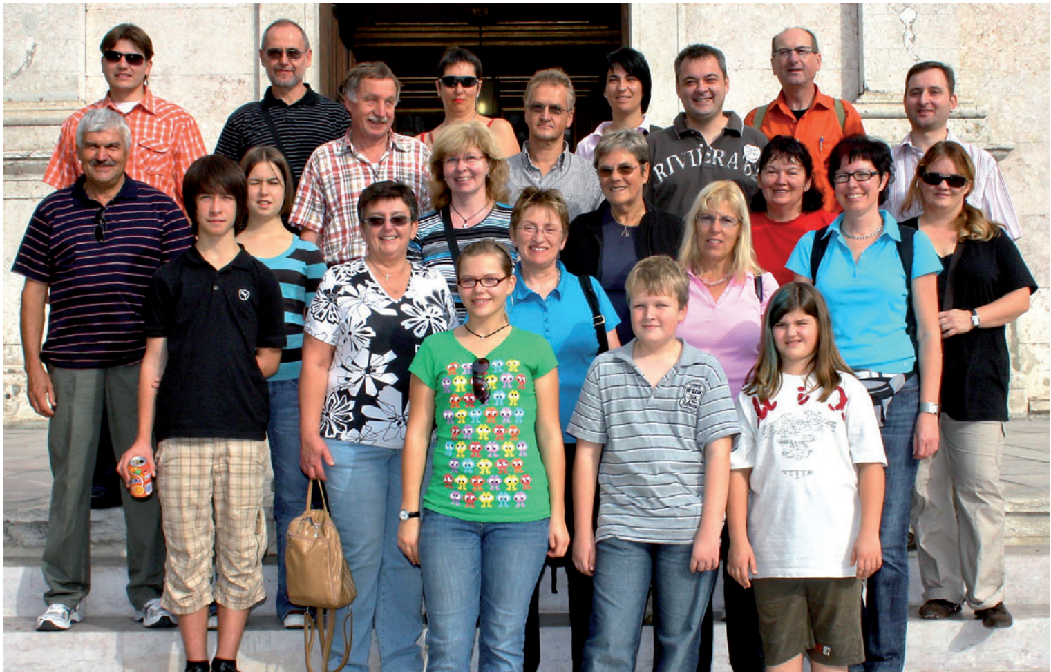
Teilnehmer der Gemeindefahrt nach Lissabon (26. - 30. Oktober 2009)