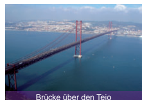
Brücke über den Tejo