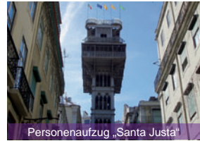
Personenaufzug „Santa Justa“

Am Abend des vorletzten Tages wurde wieder ein „Bunter Abend“ veranstaltet. Im Rahmen einer Talkshow erfuhren die Teilnehmer von lustigen oder haarsträubenden Begebenheiten, welche den einzelnen Personen in ihrer Vergangenheit, teilweise im Kindes- oder Jugendalter, widerfahren sind.