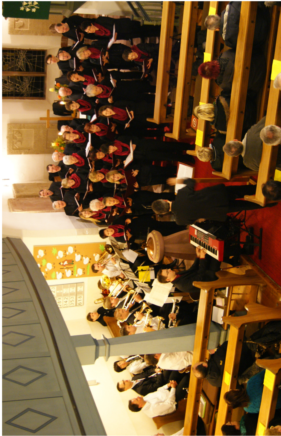
Geistliche Abendmusik Kirchenchor Obrigheim am 3. Februar 2013