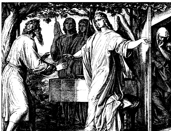
Julius Schnorr von Carolsfeld / Holzschnitt aus „Die Bibel in Bildern“ (1860): Engel bei Abraham, Ankündigung der Geburt Isaaks

Tatsächlich prophezeit der rätselhafte Gast Abraham einen Sohn. Sara lauscht am Zeltingang, denn Frauen war es damals nicht erlaubt, sich an Männergesprächen zu beteiligen. Doch als sie dies hört, kann sie nicht anders: sie beginnt zu kichern. Verständlich, denn einen Sohn hatte sie sich zwar gewünscht, doch sie ist nun 90 – und ihr Mann? Sie denkt belustigt: „Was, mit dem Alten?“ Abraham hat ja auch schon