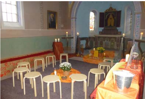
Gestaltung der Kapelle an Erntedank

Getragen wird das Projekt hauptsächlich durch ehrenamtliche Mitarbeiter. Wenn auch Sie Interesse und Freude an der Arbeit mit Jugendlichen haben und sich an dem Projekt beteiligen möchten oder Ideen und Vorschläge hätten, sind Sie jederzeit herzlich willkommen.