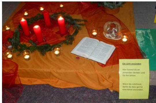
Gestaltung der Kapelle im Advent