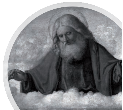
Gott, der Vater, Cima da Conegliano, 1515

Die Beispiele lassen erkennen: Kinder zwischen drei und sieben Jahre sind an allen religiösen Fragen interessiert. Aber nicht nur an religiösen Fragen und Antworten, sondern grundsätzlich an allen Dingen und Vorgängen, die sie bewusst wahrnehmen. Weil das Fragen der Kleinkinder bedeutungsvoll für den Aufbau eines Weltbildes und die ersten Wertorientierungen ist, meinen einige Religionspädagogen: Im Fragen des Kleinkindes zeigen sich die ursprüng-