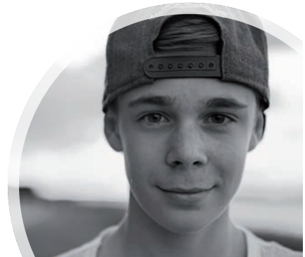
Daniel Kocherscheidt / pixello.de

Eng mit der Erfahrbarkeit verbunden ist besonders bei Kindern und Teens der Wunsch nach Echtheit vorhanden. Wenn ein Mitarbeiter in Jungschar und Teenkreis nicht das vorlebt, was er sagt, dann hat er keine Chance, positiv auf den Glauben der jungen Menschen einzuwirken. Das heißt auch, offen von seinen eigenen Fehlern, Schwächen und Kämpfen zu reden. So ist und bleibt die Arbeit mit Jungscharkindern und Teens eine spannende und herausfordernde Arbeit!