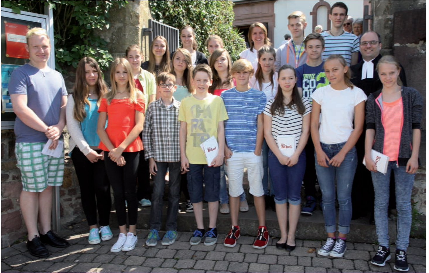
Einführungsgottesdienst in Obrigheim am 28. Juni 2015