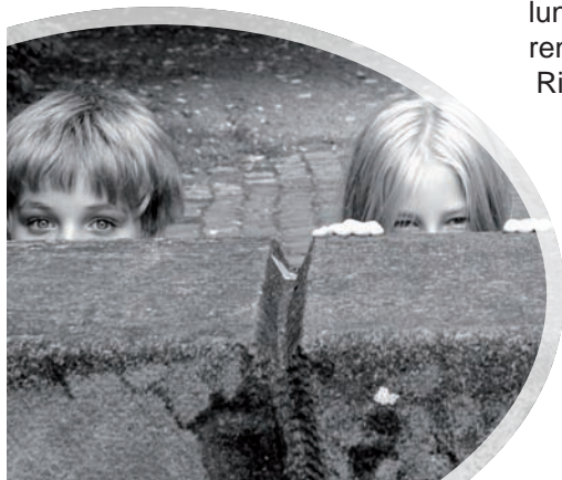
Stephanie Hofschlaeger / pixelio.de

Kinder nehmen Anregungen aus der Erwachsenenwelt, um ihre Vorstellungen genauer zu formen. Sie hören von Gott, stellen sie sich ihn als Riesen vor, der die Welt baut wie ein Handwerker ein Haus. Sie lernen: Gott ist groß, er kann mich beschützen. Für sie ist Gott so real wie alles andere auch. Oft kommen Kinder selbst darauf, mit Gott zu sprechen, sie sind Gott gegenüber unbefangen, brauchen Gott und diese Zuversicht der uneingeschränkten Liebe. Das gibt ihnen Sicherheit, macht sie