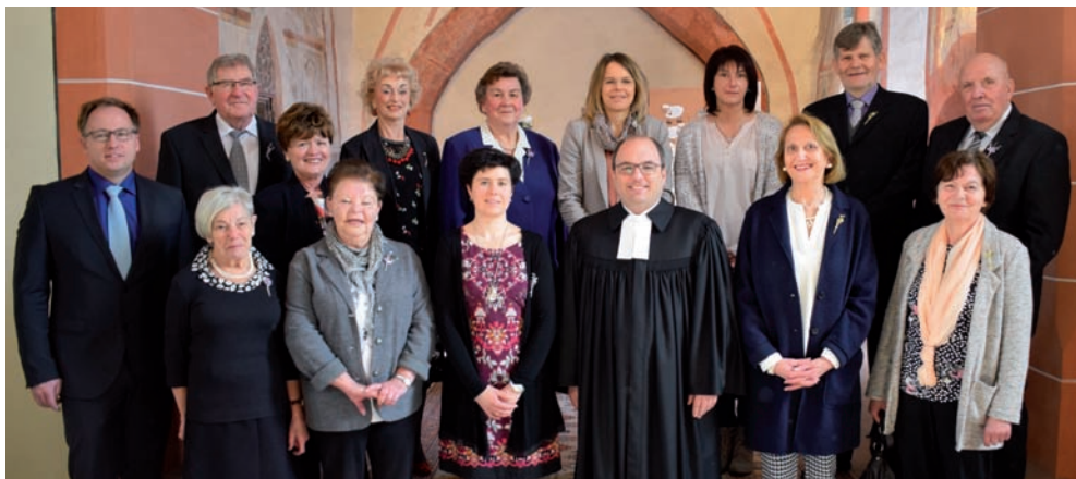
Jubelkonfirmation in Asbach am 12. März 2017