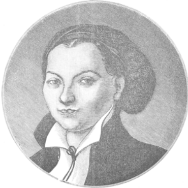
Bild: Katharina von Bora

trotz eines schweren Herzleidens im Januar 1546 nach Eisleben. Dort verstarb er am 18. Februar. Sein Leichnam wurde nach Wittenberg überführt und dort am 22. Februar 1546 in der Schlosskirche beige- setzt.