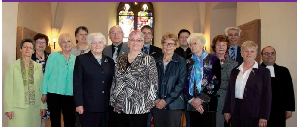
Jubelkonfirmation in Obrigheim am 2. April 2017