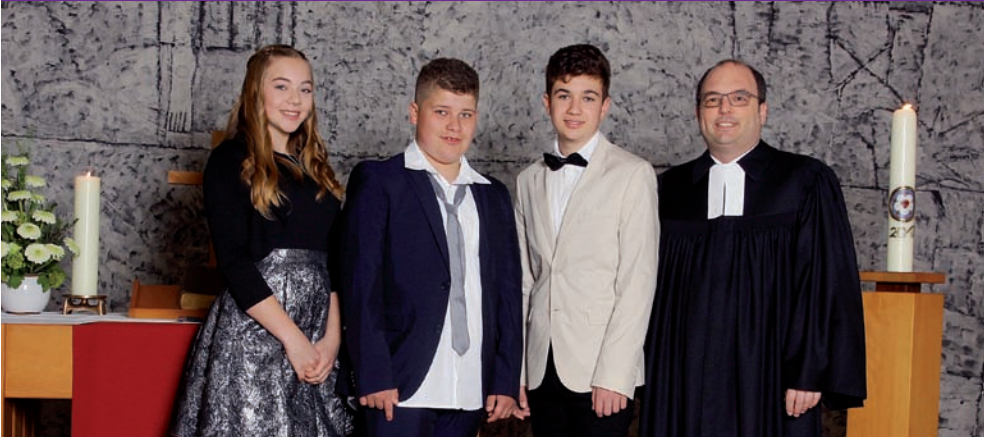
Konfirmation in Mörtelstein am 7. Mai 2017