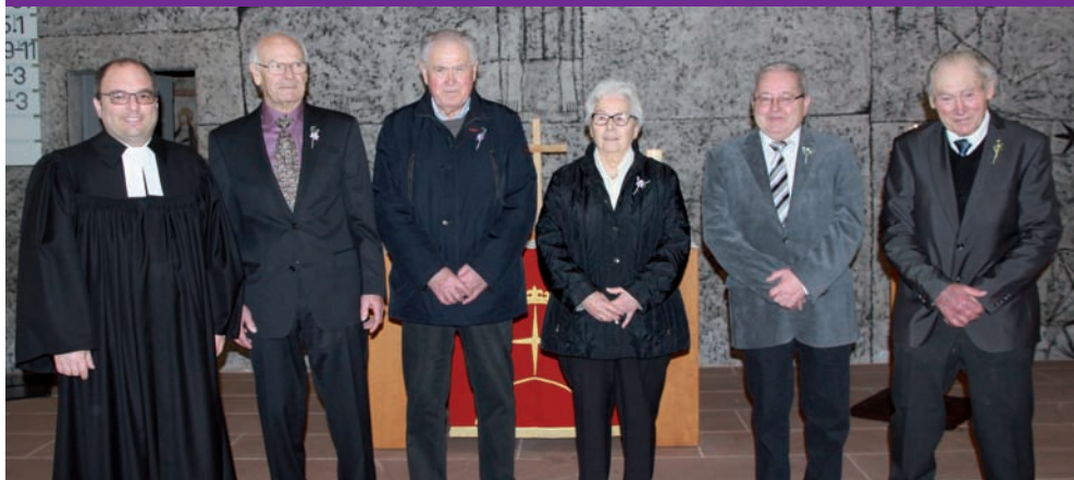
Jubelkonfirmation in Mörtelstein am 19. März 2017