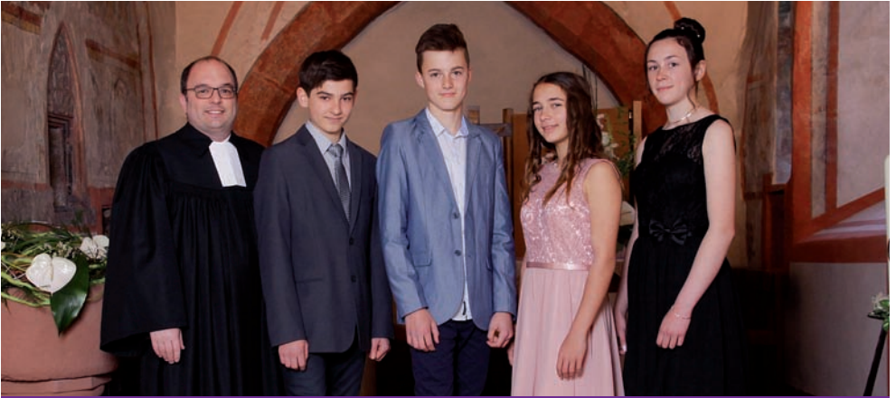
Konfirmation in Asbach am 30. April 2017