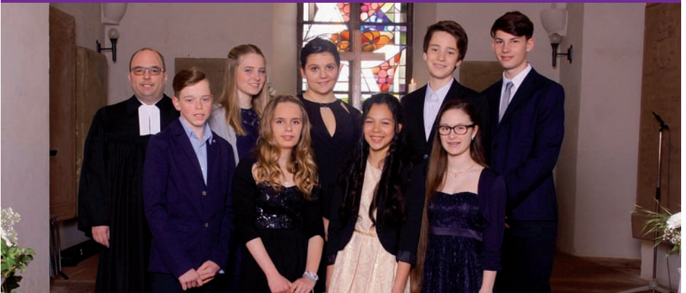
Konfirmation in Obrigheim am 14. Mai 2017