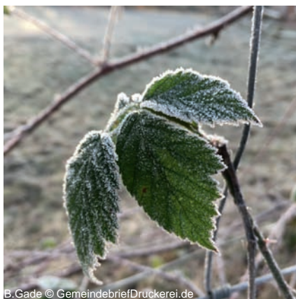
B.Gade © GemeindebriefDruckerei.de

Für diesen unvergesslichen Abend möchten wir uns recht herzlich bei allen Asbachern Chören und deren Solisten bedanken. Ein herzlicher Dank geht auch an die fleißigen Eltern, die schon Wochen zuvor mit den Vorbereitungen für unsere Wichtelwerkstatt beschäftigt waren und an alle Helfer, die mit ihrer Unterstützung zum Gelingen unseres Adventsbasars beigetragen haben.