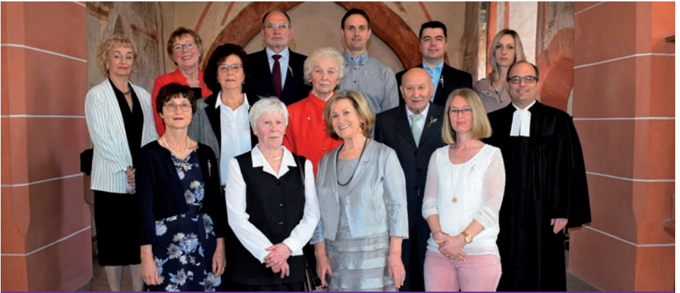
Jubelkonfirmation am 7. April 2019 in Asbach