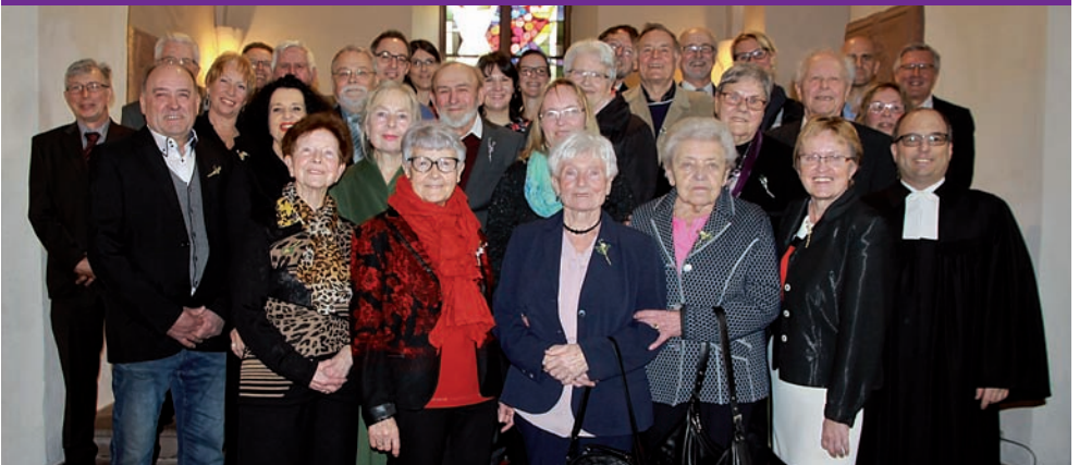
Jubelkonfirmation am 17. März 2019 in Obrigheim