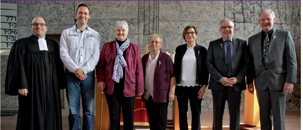
Jubelkonfirmation am 24. März 2019 in Mörtelstein